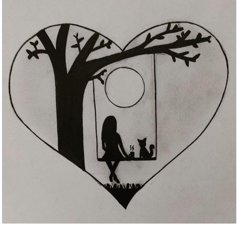
Çizim: Nursena Akpınar

Senin gülen gözlerinde, Bana gelen yollarında, Ve kaybolan yıllarımda, Tek kelime, Tek hecedir AŞK